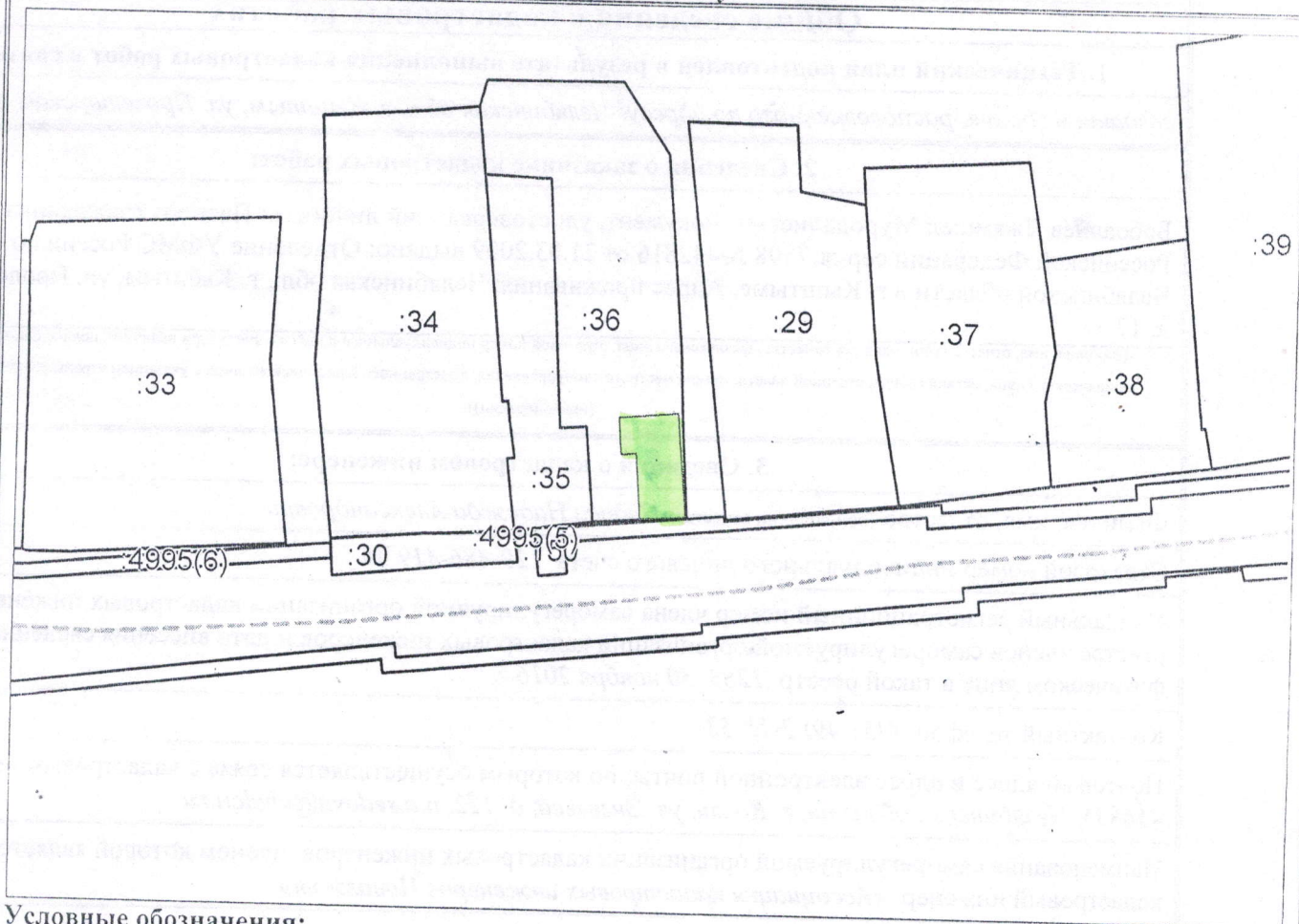
Схема расположения объекта недвижимости (части объекта недвижимости) на земельном участке