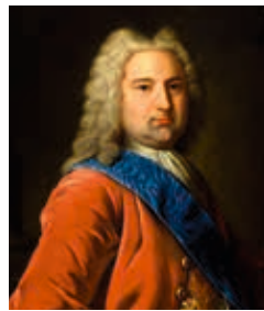
НИКИТА НИКИТИЧ ДЕМИДОВ (1688–1758) российский промышленник, служащий Берг-коллегии. Младший сын Никиты Демидова, основателя промышленной династии, и брат Акинфия Демидова

нрав города. Но есть у Кыштыма и его мягкая душа.